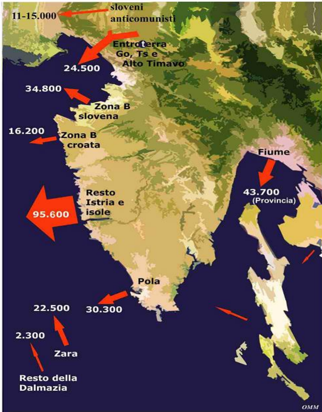
(B) Mappa partenze

L'esodo portò gli italiani giuliano-fiumano-dalmati ad approdare in Italia oppure a Trieste, anche quando la città era ancora amministrata da un governo militare anglo-americano. La maggior parte dei profughi, quelli partiti entro gli anni '40, venne "sventagliata" in un gran numero di Centri di Raccolta Profughi, distribuiti su tutto il territorio nazionale, isole comprese.